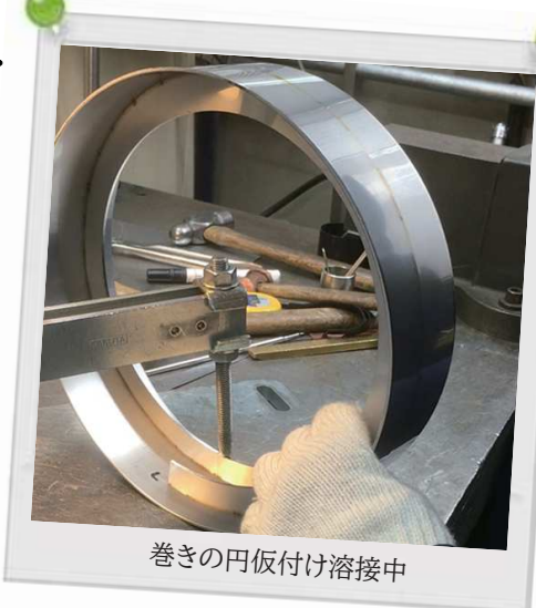
巻きの円仮付け溶接中