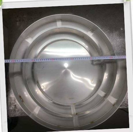
巻きの円が変形していないか確認している

て向き合いました。大変丁寧に御教授頂きまして、若手社員の良い刺激や経験になったとともに、技術力向上にもつながりました。また、そのことがカネタの現場底上げにも繋がり、現在ではその若手社員が製造のグループ長としてまとめ役となり大きな力になっています。お客様や関係各社様に大変恵まれており、お仕事や研修、修行を通じて貴重な経験をさせていただき感謝しております。